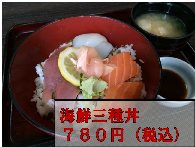
海鮮三種丼 780円(税込)