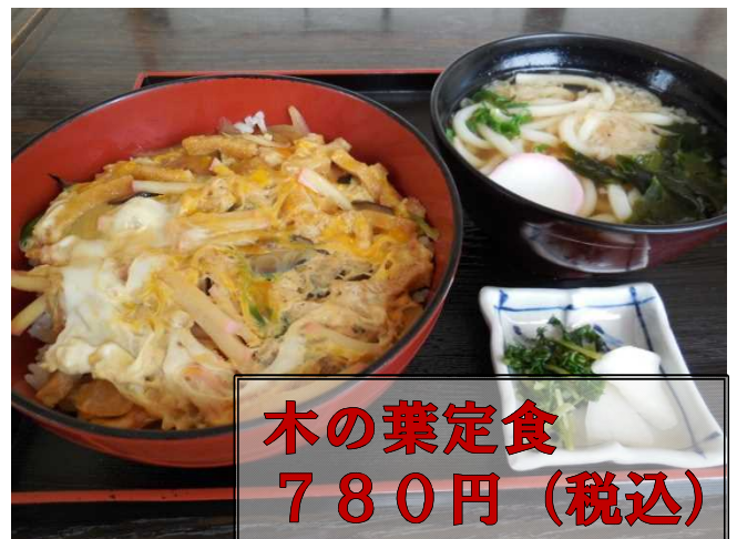
木の葉定食 780円 (税込)