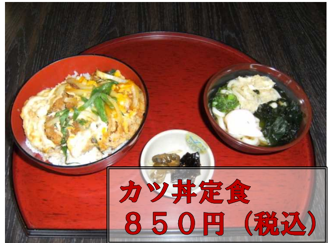
カツ丼定食 850円 (税込)