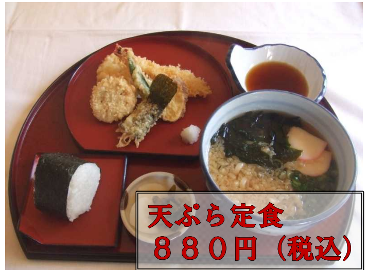
天ぶら定食 880円 (税込)