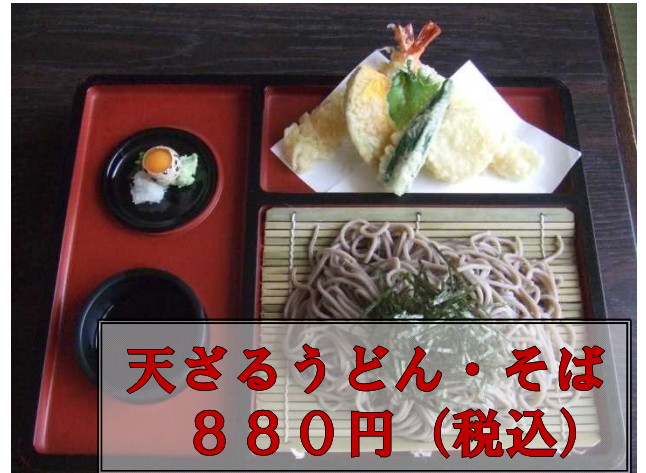
天ざるうどん・そば 880円(税込)