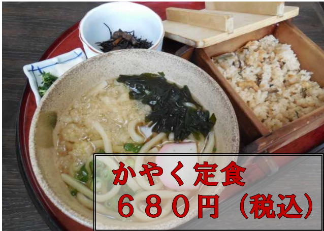
かやく定食 680円 (税込)